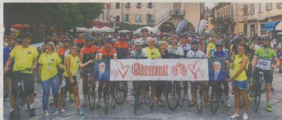
LA MANIFESTAZIONE LO SCORSO ANNO

cusio, ha detto: «E' un service per Armeno e per l'Oratorio, importante luogo di aggregazione per i giovani del paese e