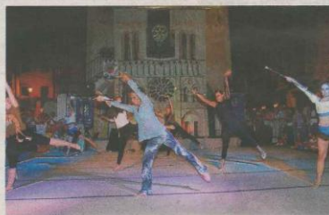
TWIRLING IN PIAZZA MOTTA AD ORTA

Alle 21 di domani, sabato 30 giugno, in piazza Motta ad Orta San Giulio, si svolgerà un'esibizione del Gruppo Twirling Santa Cristina con più di cento atlete di età tra i 5 e i 30 anni. Proponiamo straordinarie evoluzioni tecniche con il bastone nello spettacolo "Notre Dame de Paris" sulle note di Riccardo Cocciante. La serata, con finalità benefiche, è promossa da Rotary Club di Orta San Giulio e Rotaract Orta San Giulio. Saranno questi ultimi durante la serata ad organizzare una raccolta benefica, ed a dichiarare il ricavato del service. Lo spettacolo "Notre Dame de Paris" è patrocinato dalla Federazione Italiana Twirling, dal Panathlon Club Mottarone, dai Comuni di Orta San Giulio e di Borgomanero, con il sostegno dell'Avis Sovracommunale di Borgomanero e della Croce Rossa